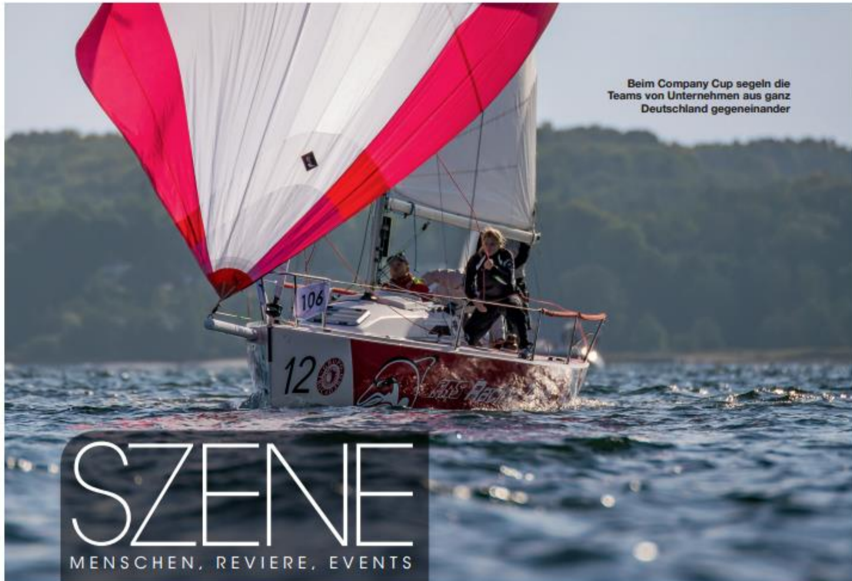
Beim Company Cup segeln die Teams von Unternehmen aus ganz Deutschland gegeneinander